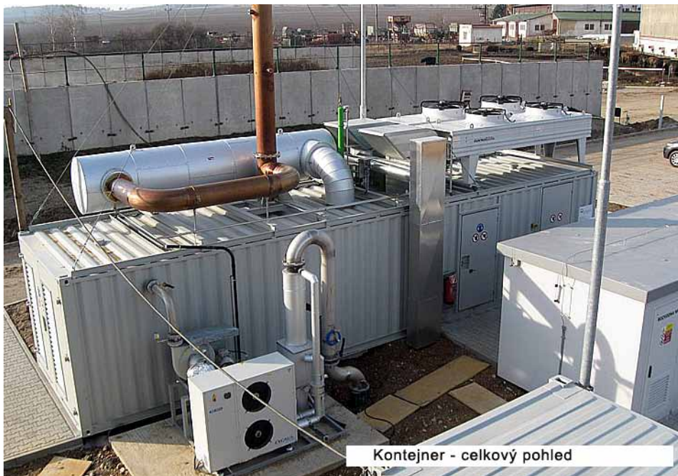
Kontejner - celkový pohled