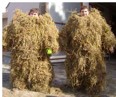
Medvědi 2013 připraveni vyrazit do maškarního reje