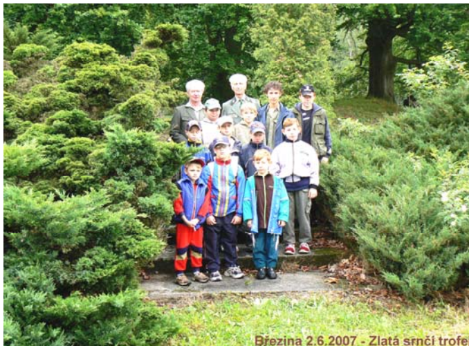
Březina 2.6.2007 - Zlatá srnčí trofej

Děti ze Základní školy Kozojedy jsou zapojeny a aktivně se účastní činností mimo školu jako jsou různé zájmové kroužky nebo sportovní klání.