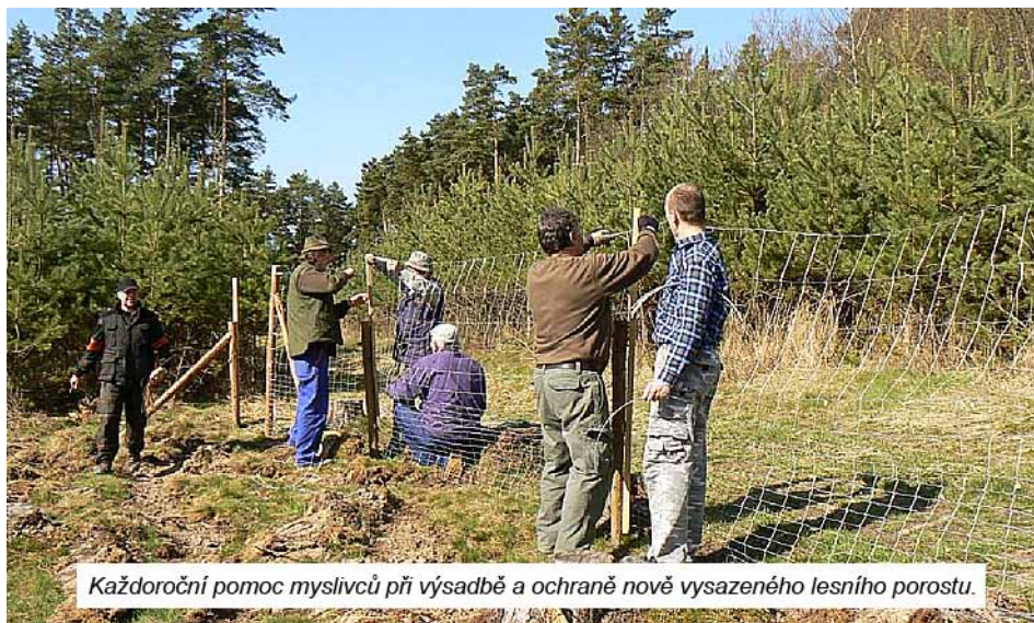
Každoroční pomoc myslivců při výsadbě a ochraně nově vysazeného lesního porostu.

Hlavní činností myslivců je úsilí o zachování přírody a krajiny, její ochrana včetně volně žijící zvěře. Zákon o myslivosti pak ukládá myslivcům mimo jiné povinnost chránit zvěř před nepříznivými vlivy.