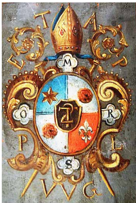
Znak opata Tytlla na jednom z obrazů v plaském klášteře

Chceme vám ještě přiblížit možná trochu nevýraznou součást kostela, která je však velmi romantickým místem obecní návsi.