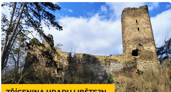
ZŘÍCENINA HRADU LIBŠTEJN

Zřícenina hradu Libštejn si zachovala výrazné části zdí a věže, které vytvářejí impozantní siluetu nad řekou. Zřícenina je přístupná celoročně.