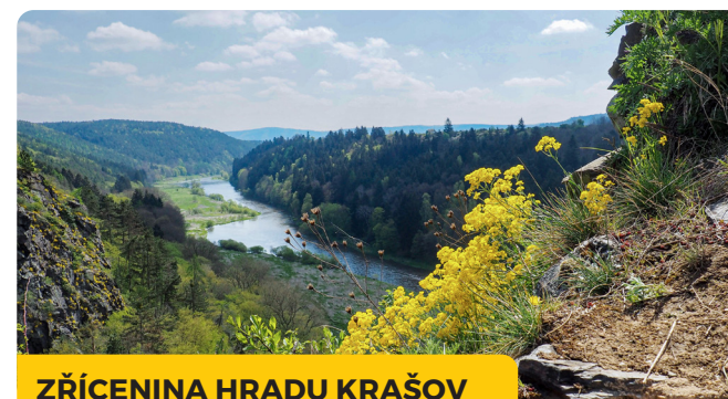
ZŘÍCENINA HRADU KRAŠOV

Skryjská jezírka jsou soustavou drobných tůní a kaskád na Zbirožském potoce. Oblast je známá také paleontologickými nálezy trilobitů.