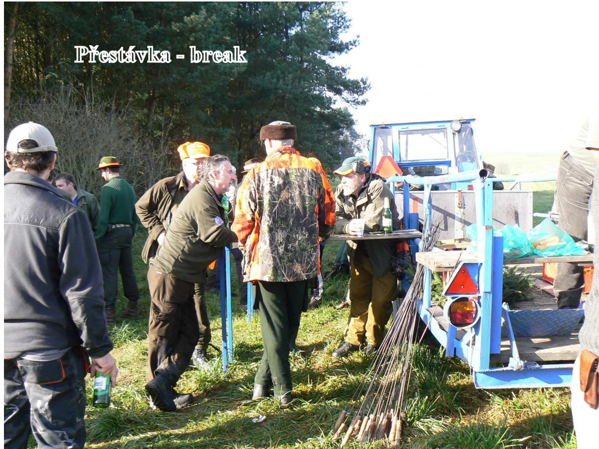
Přestávka - break