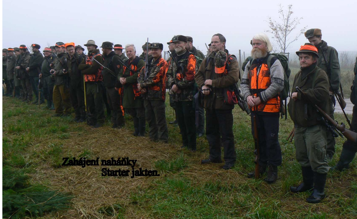
Zahájení naháňky Starter jakten.