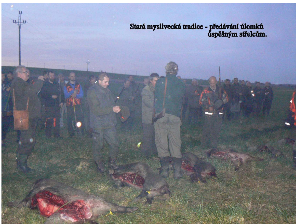
Stará myslivecká tradice - předávání úlomků úspěšným střelcům.