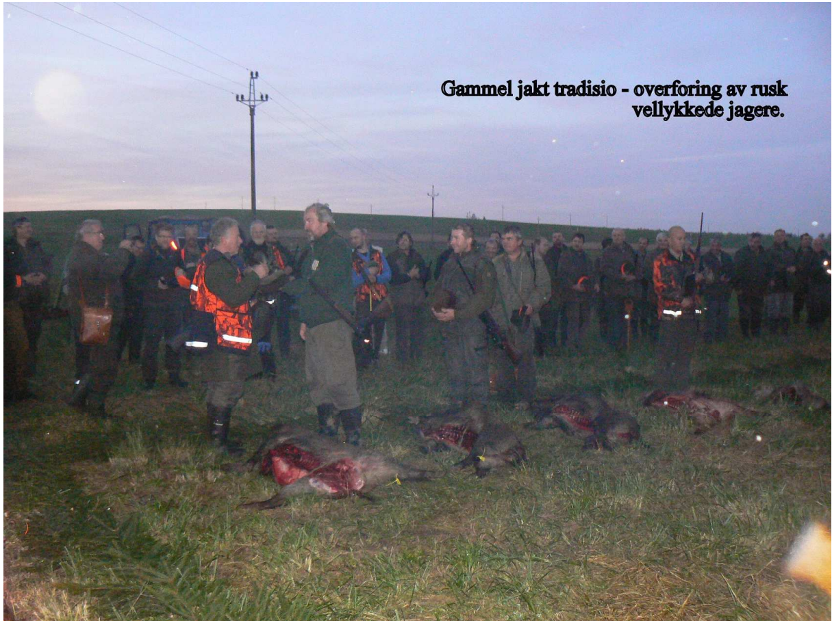
Gammel jakt tradisio - overføring av rusk vellykkede jagere.